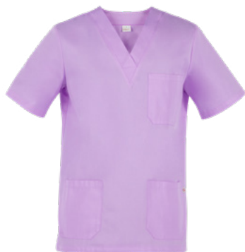
C07 Lilla chiaro