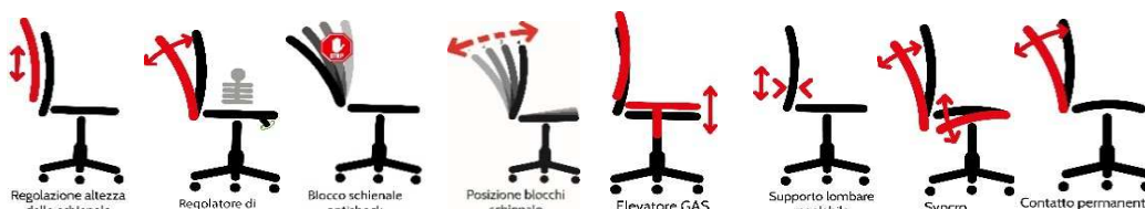
le immagini sono rappresentative dei movimenti delle sedute

Meccanismi Elevazione a gas; - regolazione Up-DOWN ; - Meccanismo synchro tra sedile e schienale e contatto permanente antishock; -