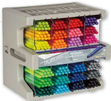
TABELLA CARATTERISTICHE DELLE PENNE FINELINER TRATTO PEN