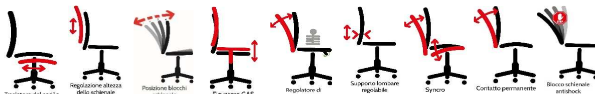
le immagini sono rappresentative dei movimenti delle sedute

Elevazione a gas; - Schienale regolabile up-down - supporto lombare regolabile contatto permanente; - Meccanismo synchro tra sedile e schienale, a contatto permanente schienale con ritorno controllato da con 4 blocchi antishock; - Sedile dotato di traslatore (avanti e indietro)